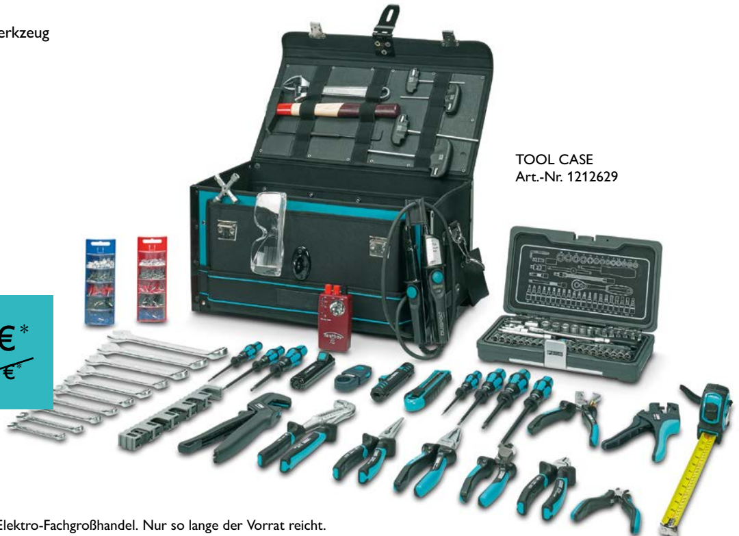
TOOL CASE Art.-Nr. 1212629

* UVP zzgl. MwSt. erhältlich bei Ihrem Elektro-Fachgroßhandel. Nur so lange der Vorrat reicht. Gültig bis zum 31.05.2019