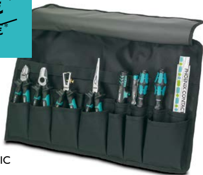
ST-A-TF-SET INSTA-BASIC Art.-Nr. 1103844